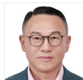
이동우 롯데지주 부회장