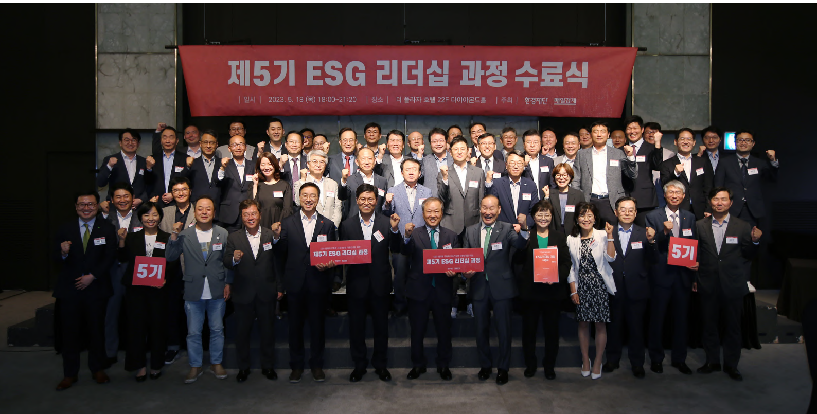
제5기 ESG 리더십 과정 수료를 맞아 참석한 모두가 축하하는 모습(65명)