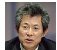
정기영 국가기후환경회의 총보위원장