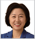
송옥주 더불어민주당 국회의원 1기

생태계 밖에서 홀로 존재하는 기업은 없습니다. 자연과 인간, 기업과 사회, 사람과 사람의 관계를 다시 한번 돌아보고 기업을 기업 밖에서 바라볼 수 있는 좋은 기회입니다.