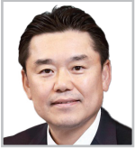
김인규 하이트진로 대표이사 사장 2기

ESG는 기업 활동의 일부가 아니라 기업이 궁극적으로 추구하는 미션, 비전에 내재화되어 있는 경영철학입니다. 'ESG 리더십 과정'은 여러 분야의 리더들에게 ESG의 정신을 보다 깊이 이해하고 이를 구현할 수 있도록 도움을 주는 훌륭한 기회가 될 것입니다.