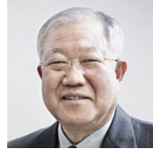
박재갑 한국세모주연구재단 이사장