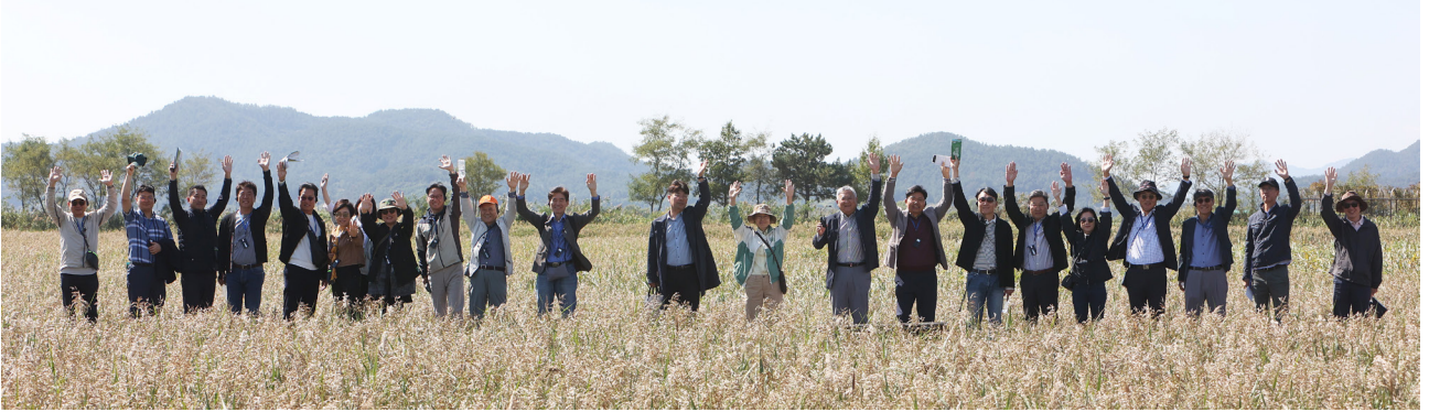
강원 경포해변에서 진행한 지구쓰담 CEO플로깅(2기)