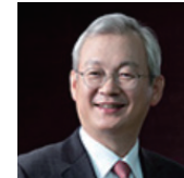
정영재 NH투자증권 대표이사