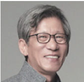
유홍준 명지대학교 미술사학과 석좌교수