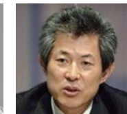
엄기영 국가기후환경회의 총보위원장