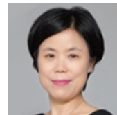
노소라 노소라법률사무소 변호사