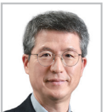
오세철 삼성물산 대표이사 사장 2기

2기 과정을 들으면서 의·약학분야에서도 ESG의 이해가 중요함을 절실히 느끼게 되었습니다. 직업적으로 폭이 좁을 수 밖에 없는 일상에서 환경의 변화, 사회적 가치, 익숙해져 버린 종적인 지배구조를 개선할 특별한 기회가 될 것 입니다.