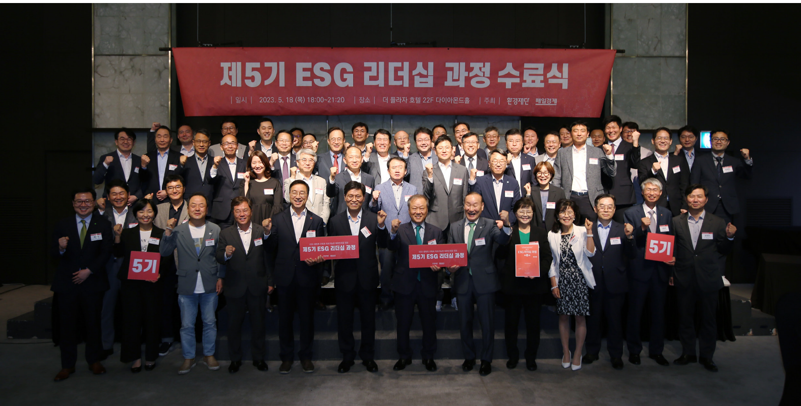
제5기 ESG 리더십 과정 수료를 맞아 참석한 모두가 축하하는 모습(65명)